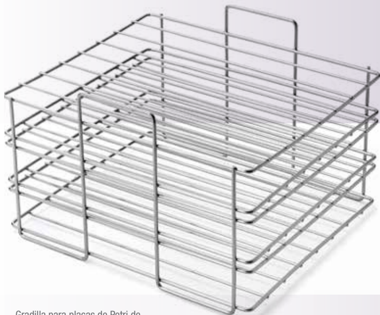
Gradilla para placas de Petri de acero inoxidable