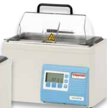
Baño de agua GP 05