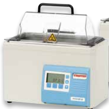
Baño de agua GP 2S