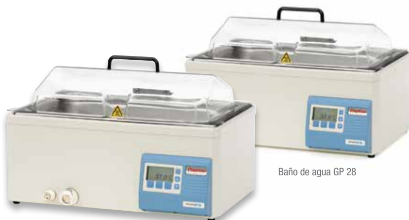
Baño de agua GP 28