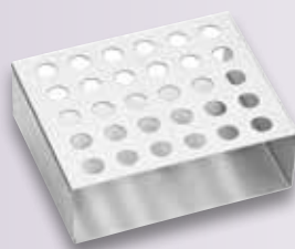
Gradilla para tubos de microcentrífuga