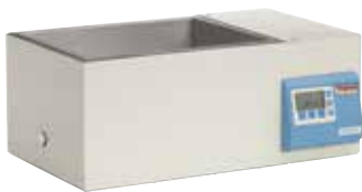
Baño de agua CIR 19