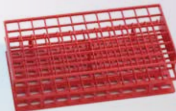
Gradilla completa para tubos de ensayo Nalgene Unwire