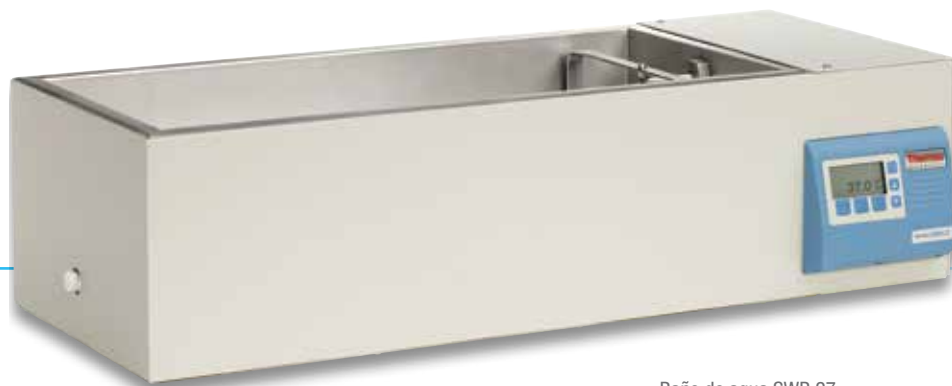
Baño de agua SWB 27