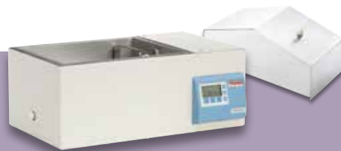
Baño de agua DUB 15