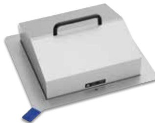
Cubierta de dos vertientes de policarbonato