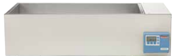
Baño de agua CIR 89