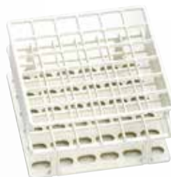
Semigradilla para tubos de ensayo Nalgene Unwire