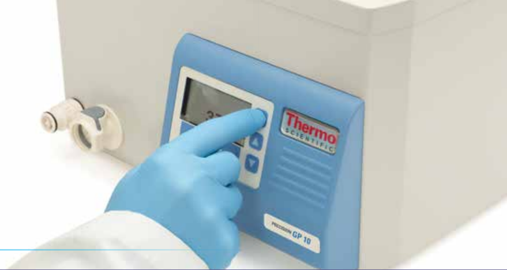
Baños de agua Thermo Scientific Precision