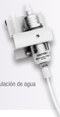
Kit de regulación de agua