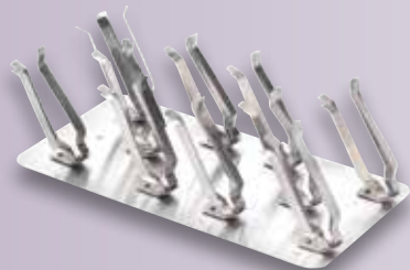
Bandeja para tubos de ensayo