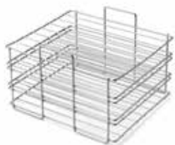
Gradilla para placas de Petri de acero inoxidable