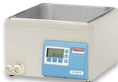
Baño de agua GP 10