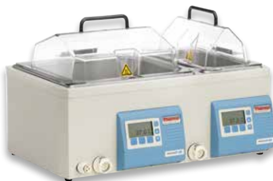
Baño de agua GP 15D