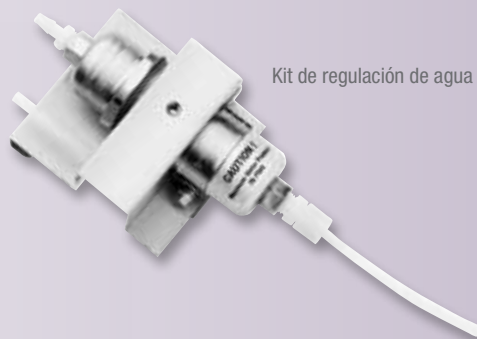
Kit de regulación de agua