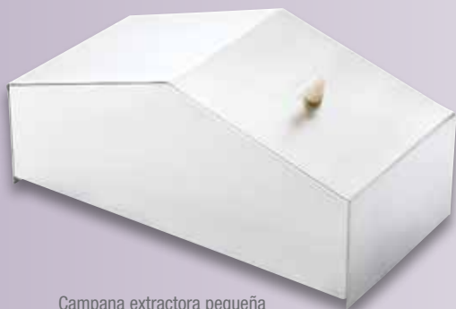
Campana extractora pequeña