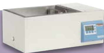
Baño de agua SWB 15S