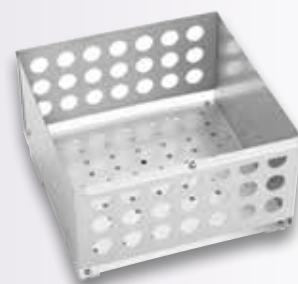
Bandejas con laterales altos