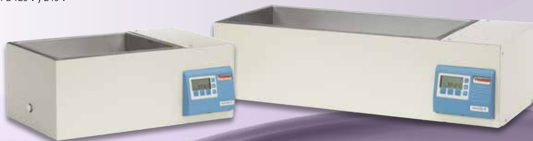
Baño de agua COL 35