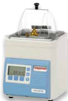
Baño de agua GP 02