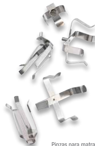
Pinzas para matraces