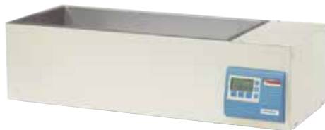
Baño de agua CIR 35