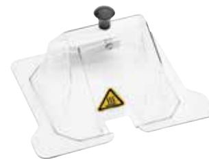
Cubierta de dos vertientes de policarbonato