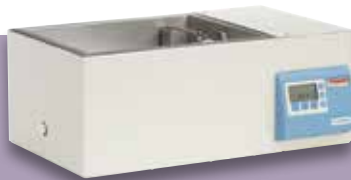
Baño de agua SWB 15