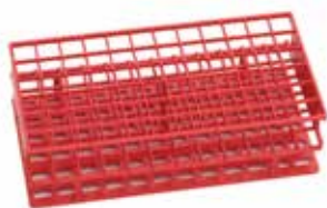
Gradilla completa para tubos de ensayo Nalgene Unwire